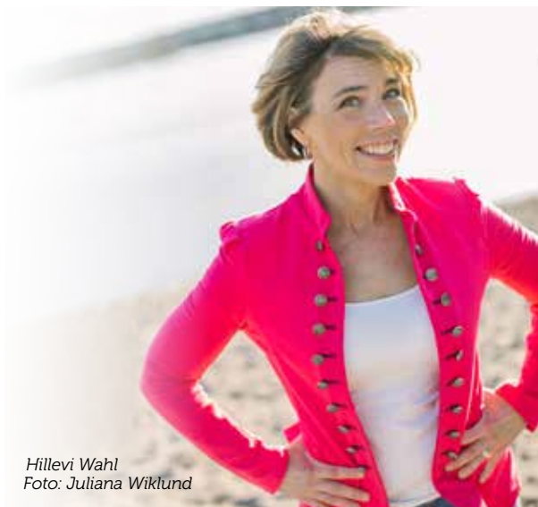
Hillewi Wahl

Kom och få en inspirerande föreläsning om att hitta sina inre superkrafter, av och med författaren till boken "Äg ditt liv: så får du mer tid, kraft och glädje". Hillewi Wahl är en erfaren journalist och krönikör känd från flera av Sveriges största tidningar.